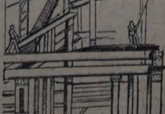
La difícil y peligrosa operación de colocar los tirantes en el alto del armazón